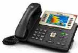
Secretaria Yealink T29G