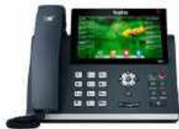
Premium Yealink T48S