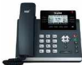
Ejecutivo Yealink T41S