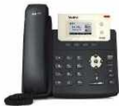
Básico Yealink T21P E2

Soluciones de telefonía tradicional, central telefónica y videoconferencia en tiempo real (mediante dispositivos fijos y móviles).